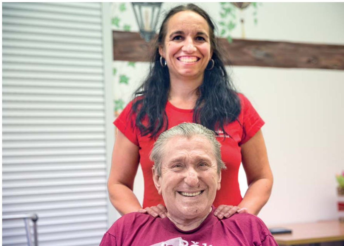
Charita Česká republika: Je nám sto let, ale žijeme současností a máme v týmu skvělé lidi. Ilustrační snímek Jakub Žák